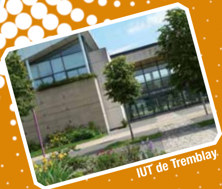
IUT de Tremblay