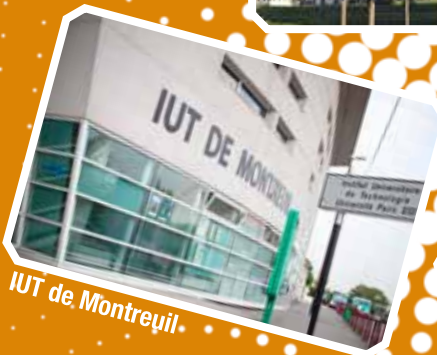
IUT de Montreuil