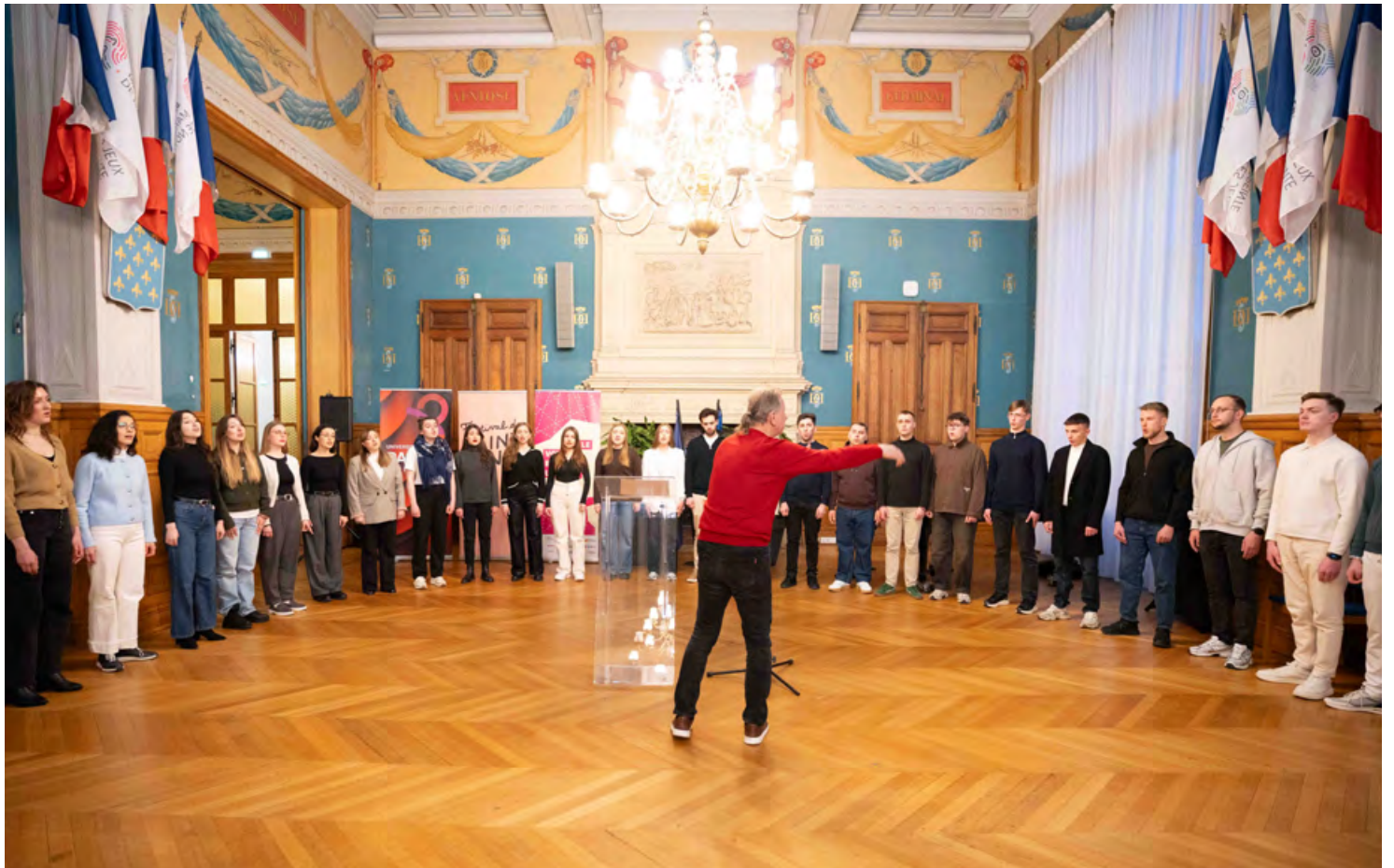
Le Choeur de chambre de Kyiv, dirigé pa Mykola Hobdych