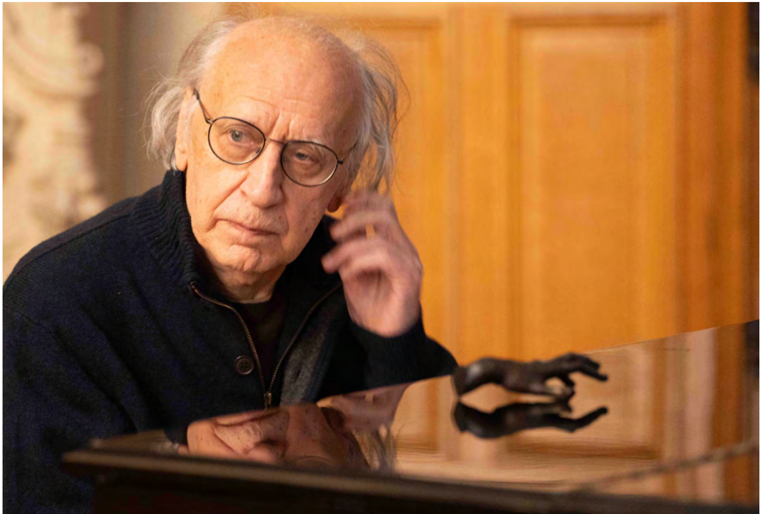
Valenty Silvestrov interprétant sa nouvelle oeuvre « Instants de mémoire »