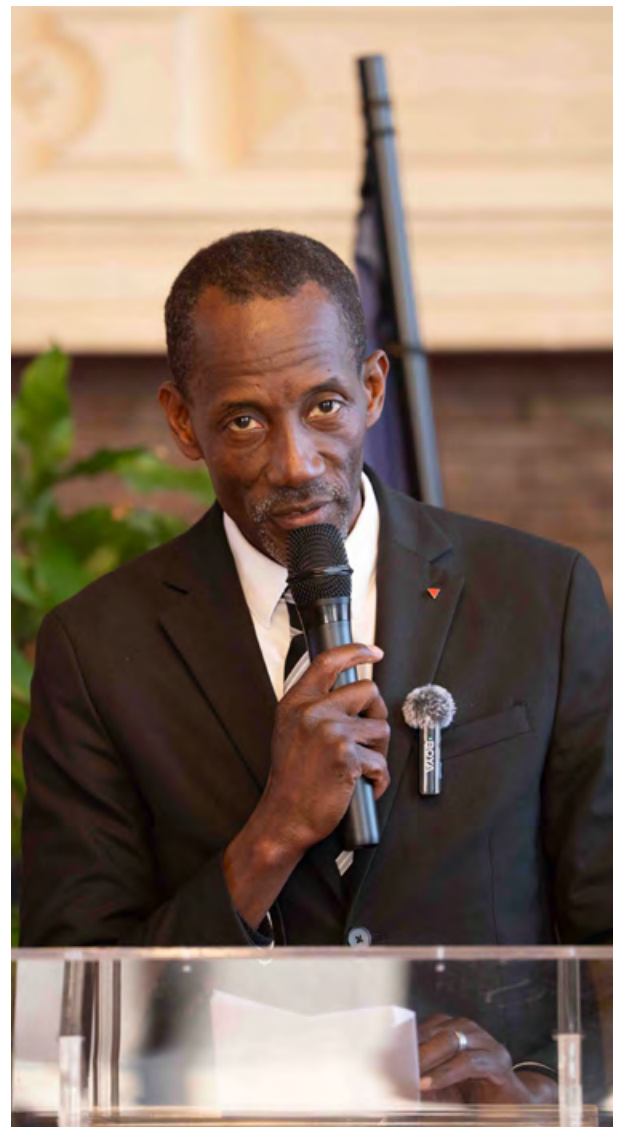
Bally Bagayoko, maire de Saint-Denis