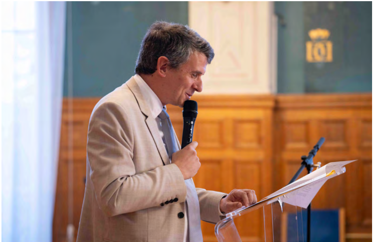
Arnaud Laimé, président de l'université Paris 8