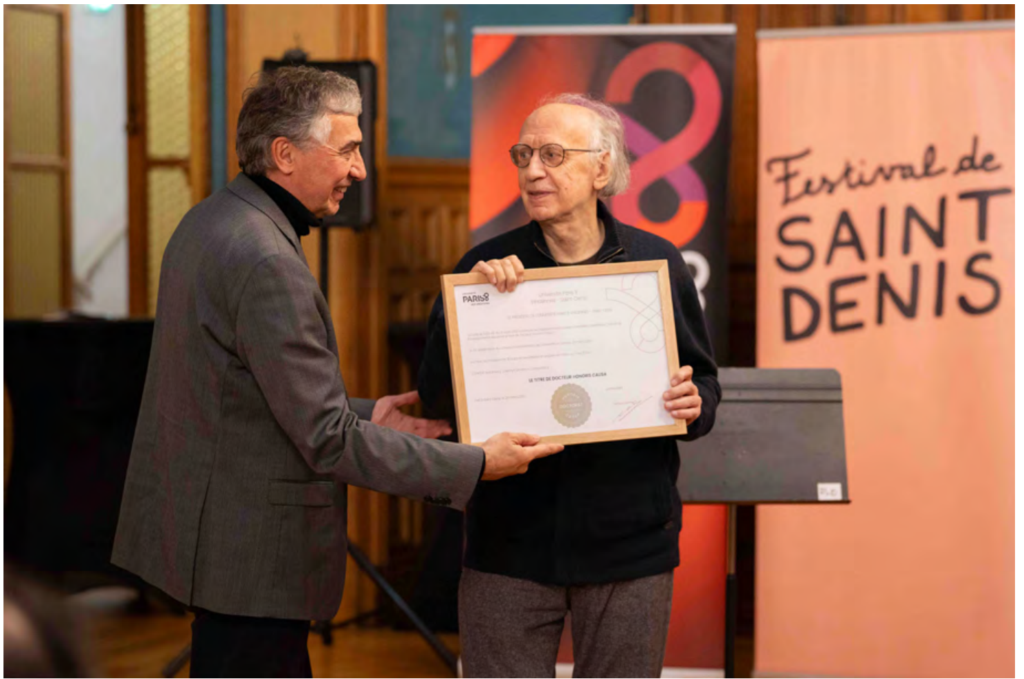
Constantin Sigov et Valentyn Silvestrov