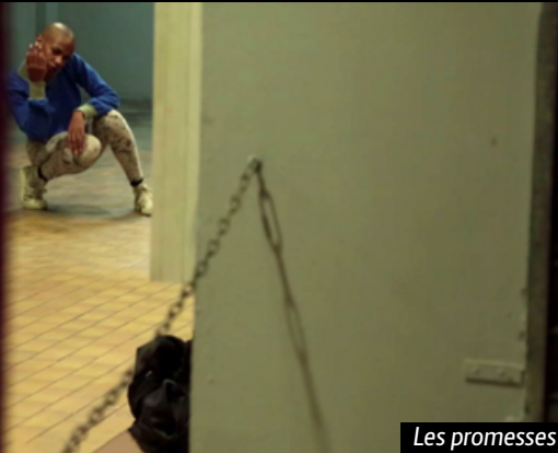
Les promesses du sol