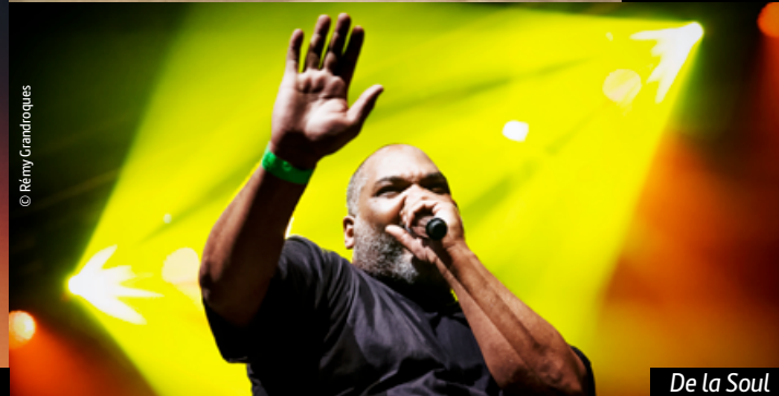
De La Soul