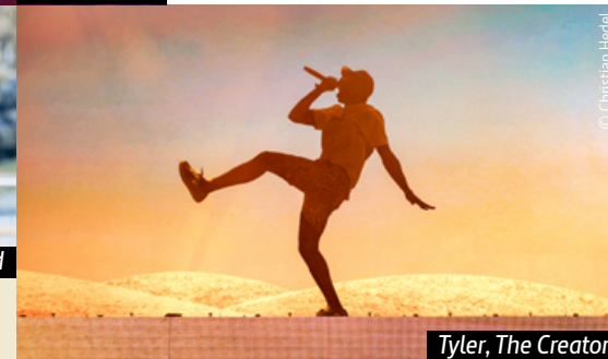
Tyler, The Creator