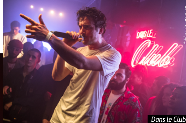
Dans le Club