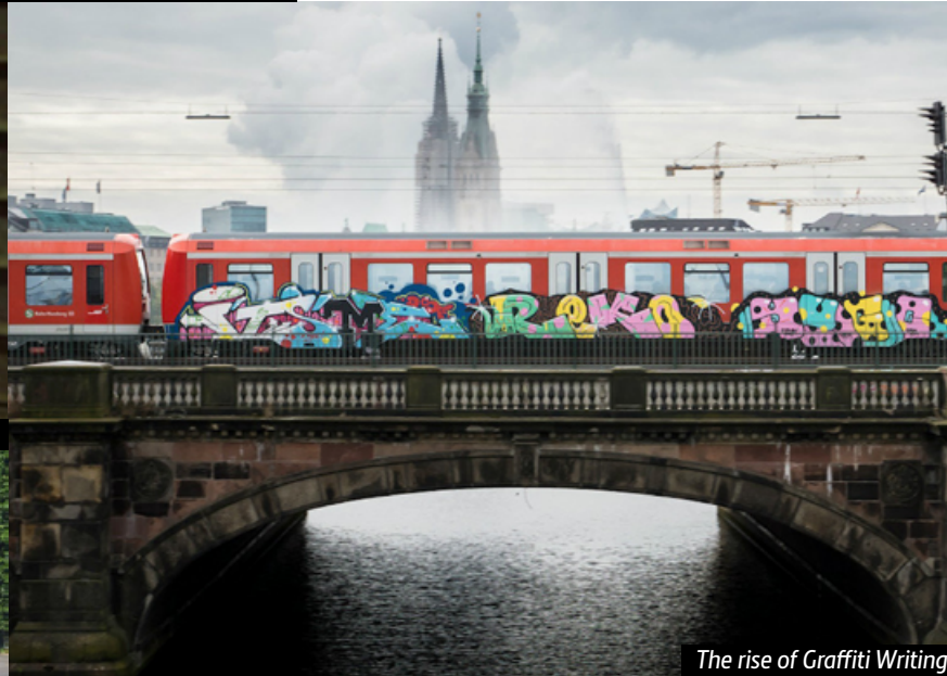
The rise of Graffiti Writing