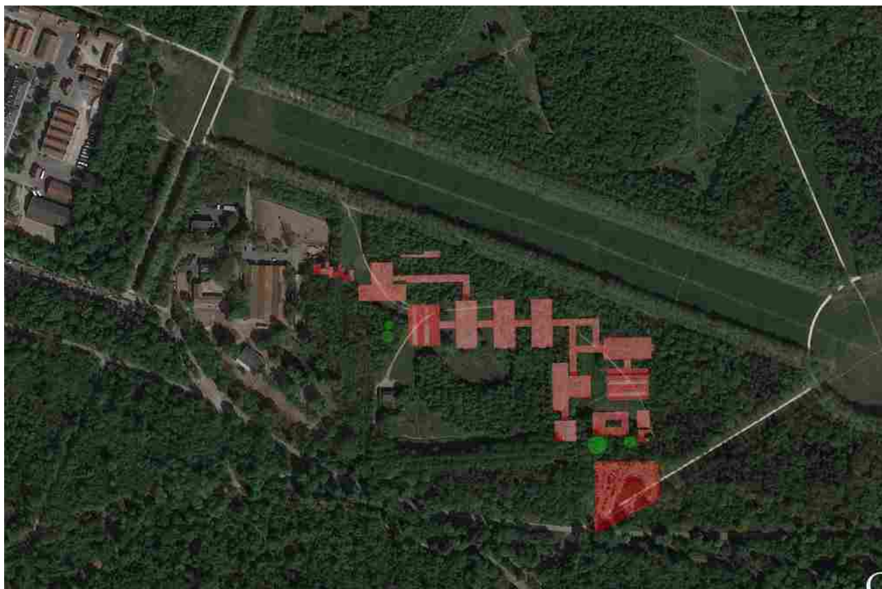
Reconstitution par Jean-Louis Boissier de l'implantation de l'Université en 1969 ( http://www.rvdv.net/ )

Renseignements pratiques : cinquantenaire@univ-paris8.fr