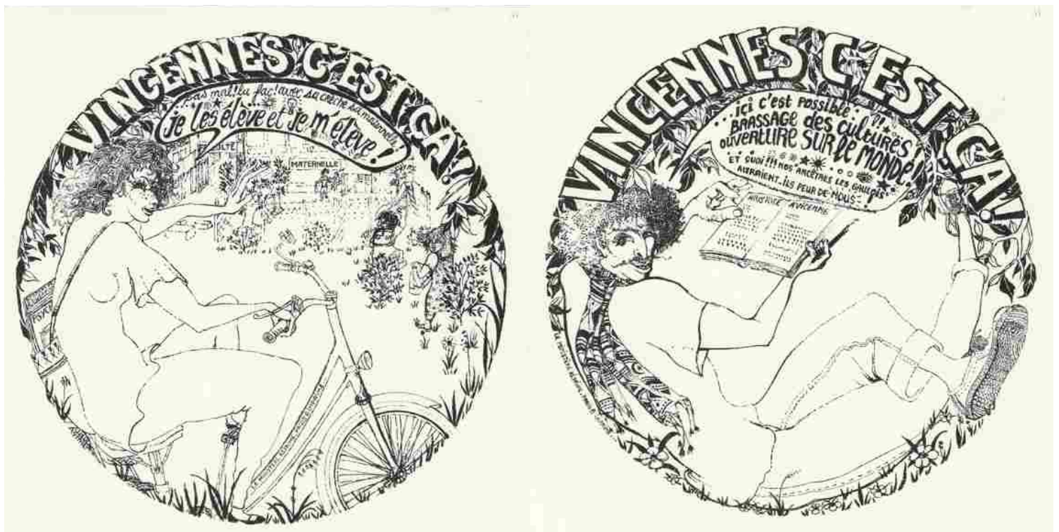
Autocollants dessinés par Jean-Pierre Bellan, 1979

Un questionnaire a été lancé par le service des archives.