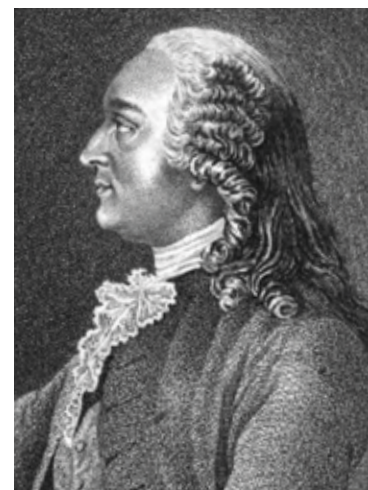
Portrait gravé de Turgot, in Pierre-Samuel Dupont de Nemours (éd.), Œuvres posthumes de M. Turgot , Lausanne, 1787, n. p.