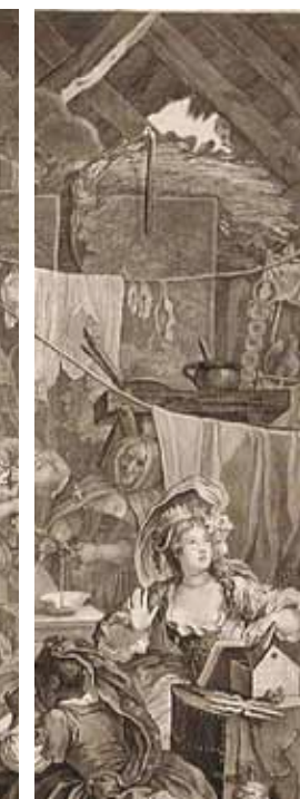
Strolling Actresses in a Barn, Hogarth